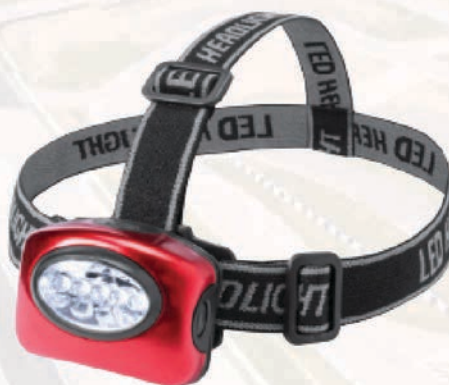
Frontal Camí de Llum.

El precio del frontal es de 8 € la unidad.