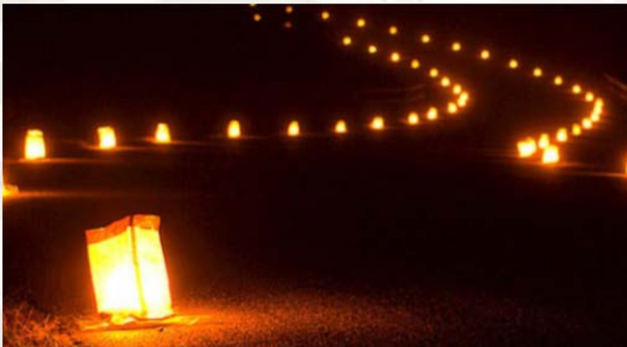
Camino de velas y música clásica.

Las clasificaciones oficiales se publicarán en el enlace www.elitechip.net .