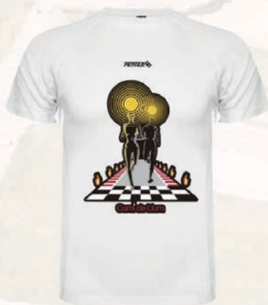
Camiseta Camí de Llum.

El precio de la camiseta es de 15€ la unidad.