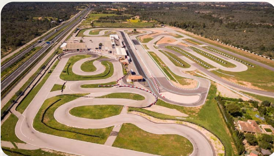
Circuito Mallorca en Lucmajor.