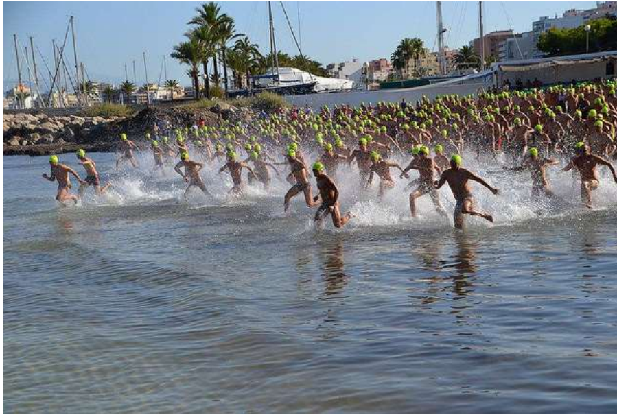
Participantes de la XII Sa Milla 2015