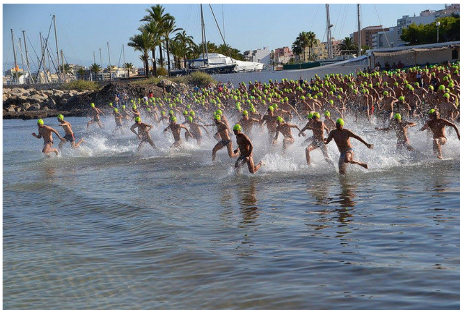
Participantes de la XII Sa Milla 2015

Gracias por participar y disfrutad de esta bonita travesía.